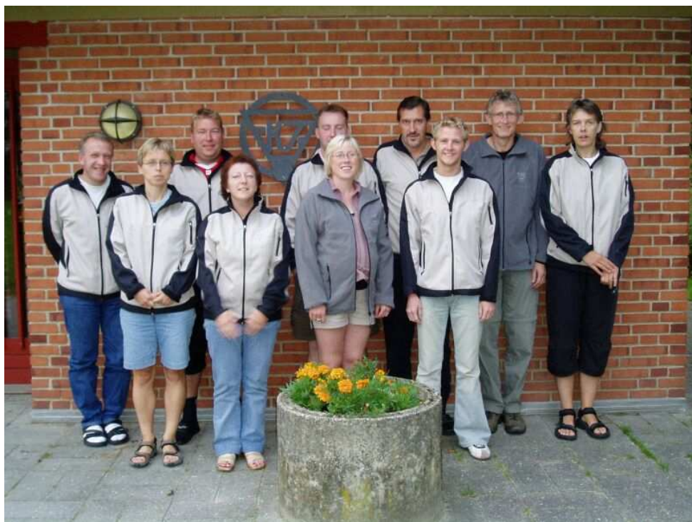
Hovedparten af bestyrelsesmedlemmerne i FK73 – i klædt de flotte klubjakker med broderet FK73-logo.

Bestyrelsen i FK73 består af i alt 13 personer: